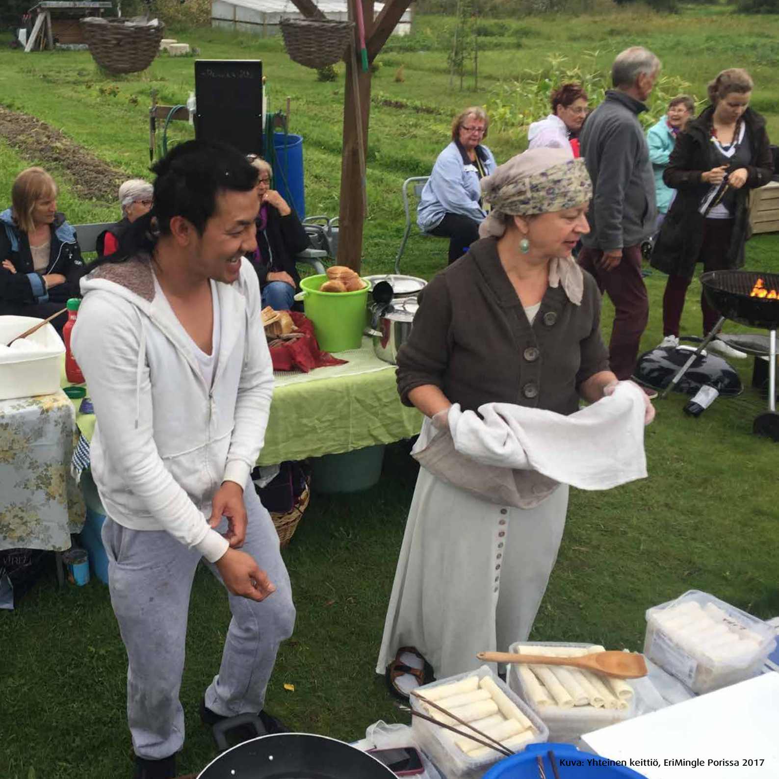
Kuva: Yhteinen keittiö, EriMingle Porissa 2017