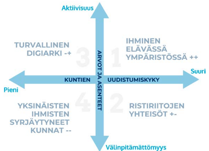
Kuvio 2. Hyvinvoinnin skenaariot

Seuraavassa tarkastellaan näitä neljää eri skenaariota tarkemmin. Kunkin skenaarion alussa kuvataan skenaarion tarina ja esitetään sen taustalta löytyvät muutosvoimat. Skenaarioiden vaikutuksia tarkastellaan myös erilaisten kuntalaisten hyvinvoinnin näkökulmasta ja esitellään joukko toimenpiteitä, joilla kuntalaisten hyvinvointia voidaan eri skenaarioissa edistää. Toimenpiteet ehkäisevät skenaarion ei-toivottuja vaikutuksia ja edistävät toivottuja vaikutuksia.