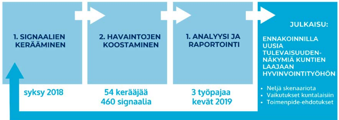
Kuva 2. Kunta hyvinvoinnin edistäjinä -verkoston ennakointiprosessi

erilaisilla strategisilla valinnoilla. Kunta hyvinvoinnin edistäjänä -verkoston ennakointityö on ollut prosessi, jonka tavoitteena on ollut luoda näkymiä kuntien mahdollisista, erilaisista tulevaisuuksista. Samalla tarkoituksena on kannustaa kuntia oman